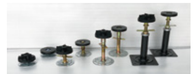
手前：S脚（スタンダード支柱） 奥：B脚（ボーダー支柱）